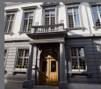
Sorell Hotel Zunfthaus zum Rüden, Schaffhausen

Schweizerische Gesellschaft für Orale Implantologie (SGI) Schweizerische Gesellschaft für Oralchirurgie und Stomatologie (SSOS) Schweizerische Gesellschaft für Parodontologie (SSP) Schweizerische Gesellschaft für Rekonstruktive Zahnmedizin (SSRD)