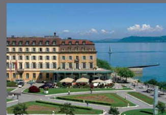
Beau-Rivage Hôtel, Neuchâtel