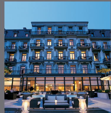
Hôtel des Trois Couronnes, Vevey

Société Suisse d'implantologie orale (SSIO), www.sgi-ssio.ch Société Suisse pour la chirurgie orale et la stomatologie (SSOS), www.ssos.ch Société Suisse de parodontologie (SSP), www.parodontologie.ch Société Suisse de médecine dentaire reconstructive (SSRD), www.ssr-d.ch