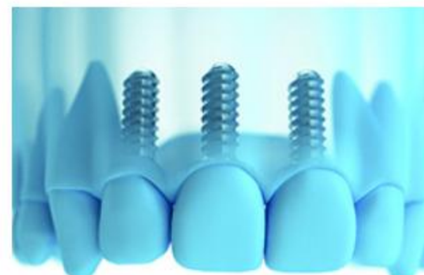
... so kann entweder jeder fehlende Zahn durch ein Implantat mit Krone ersetzt werden, ...