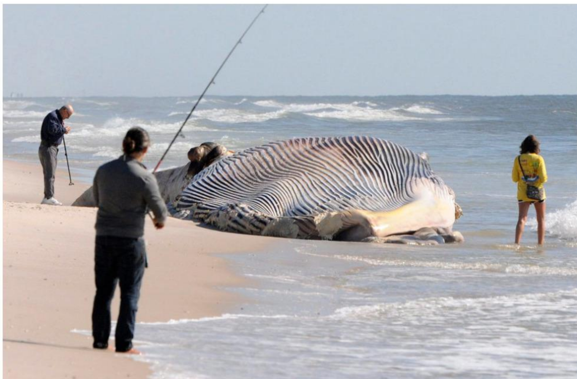
Trauriger Anblick auf dem Trocken: Badegäste betrachten einen 17 Meter langen toten Finnwal, der aus noch ungeklärten Gründen in Shirley, östlich von Long Island, strandete. (9. Oktober 2014) Mehr...