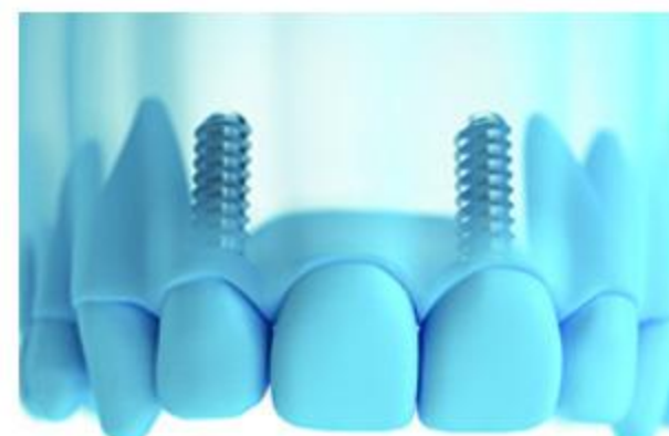
... oder aber man wählt eine Lösung mit einer Brücke, um die Zahl der Implantate zu verringern.